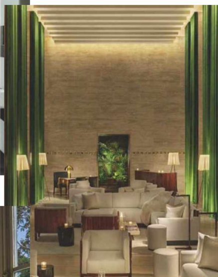
3. THE ROME EDITION (ROMA)

4. Seda Club Hotel es (por fin) el primer cinco estrellas gran lujo que Granada necesitaba: 21 habitaciones en la Plaza de la Trinidad con interiorismo nada menos que de Rockwell Group y el sello de Small Luxury Hotels ( seddaclubhotel.com ).