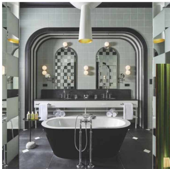
2. W BUDAPEST (BUDAPEST)