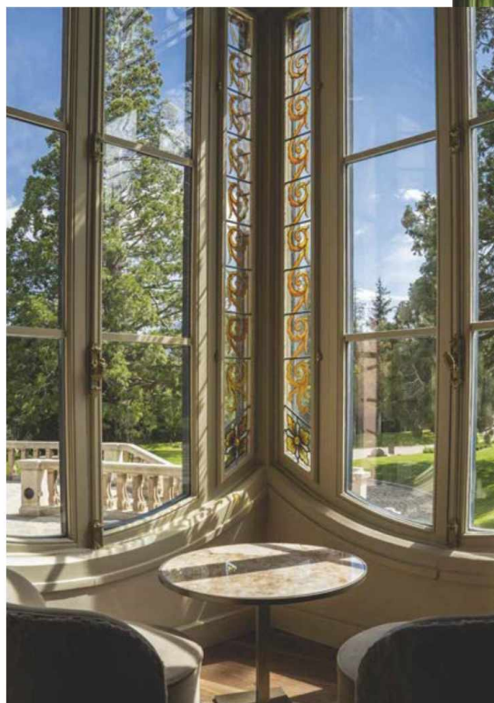
5. SERRAS TORRE DEL REMEI (BOLVIR, GIRONA)