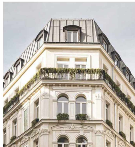
1. CHÂTEAU DES FLEURS (PARÍS)